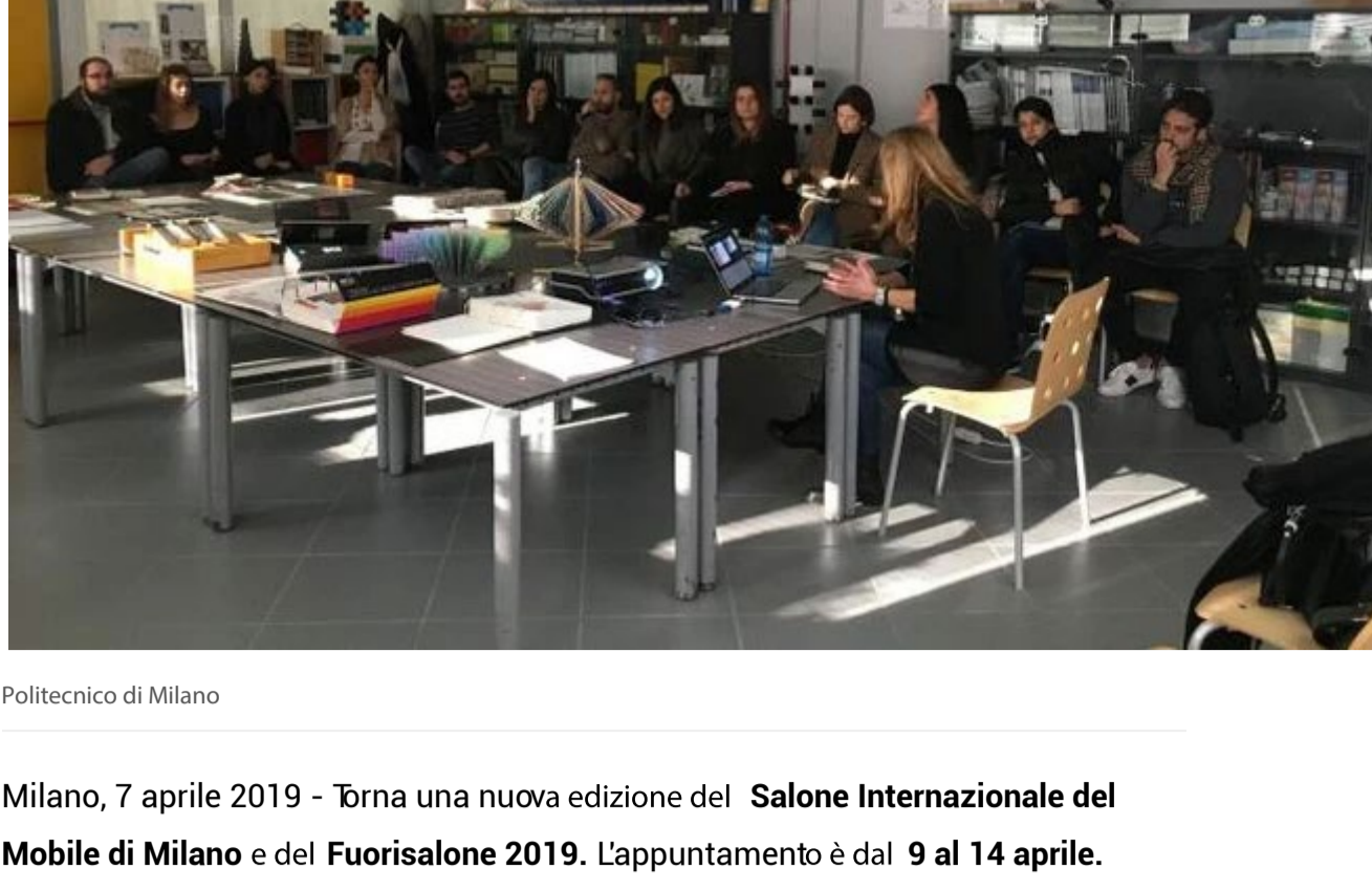
Politecnico di Milano

Ultimo aggiornamento il 8 aprile 2019 alle 11:02