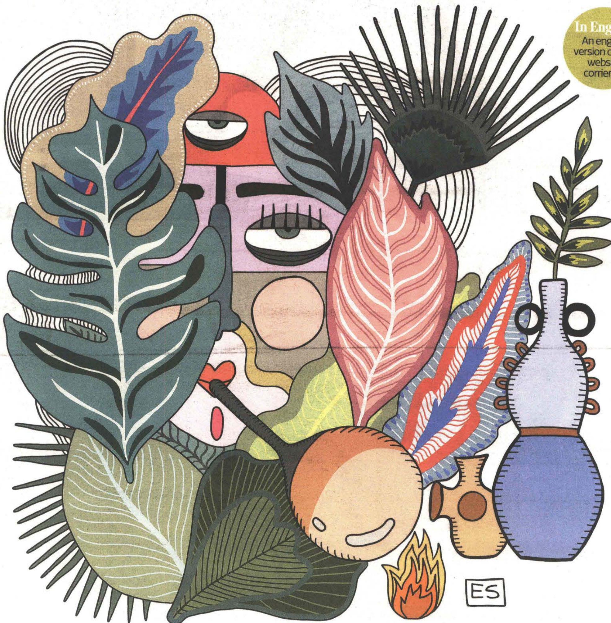
ILLUSTRAZIONE DI ELEMA SALMISTRARO

An english version on the website corriere.it