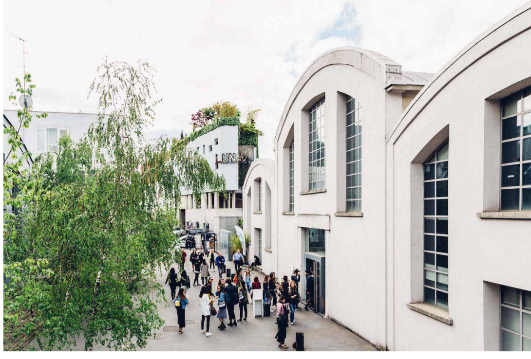
Scuola Mohole/Ph Simone Furioli

Il design sostenibile, l'industria e la creatività saranno protagonisti nel Lambrate District durante la MDW 2019.