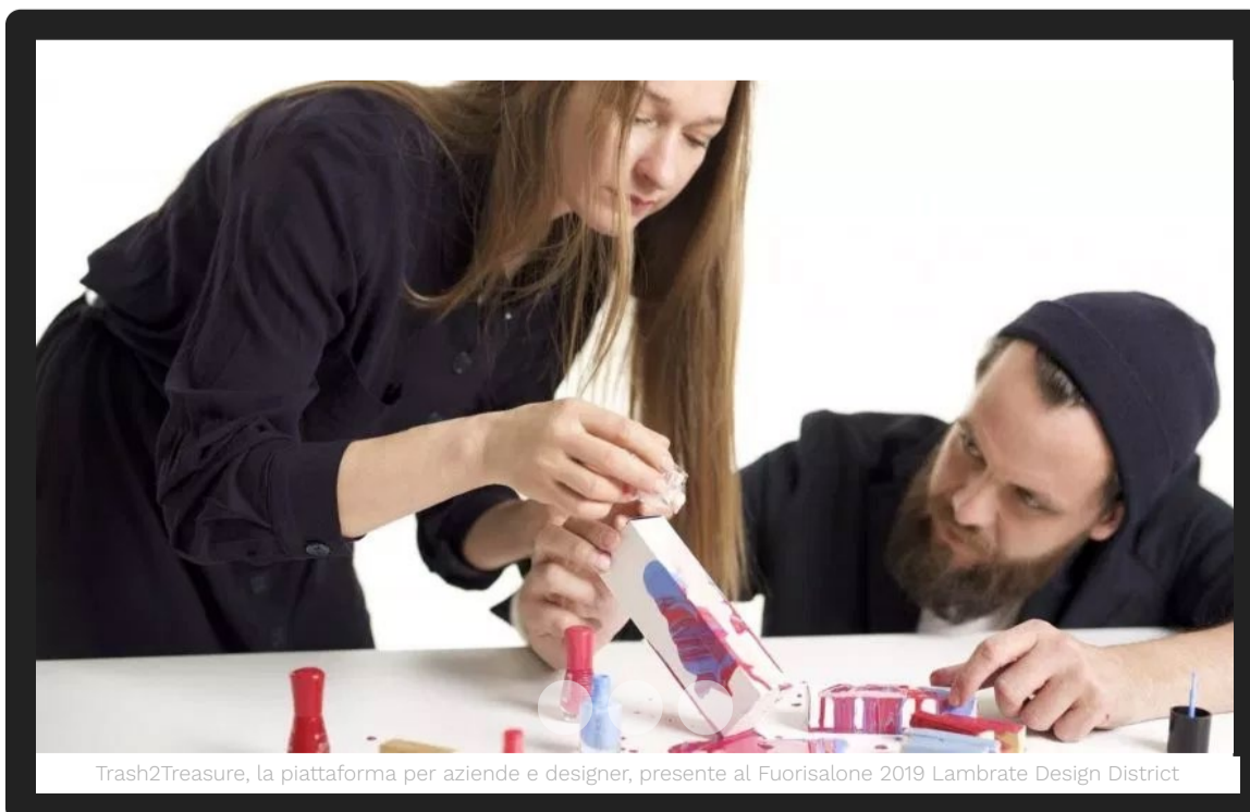
Trash2Treasure, la piattaforma per aziende e designer, presente al Fuorisalone 2019 Lambrate Design District