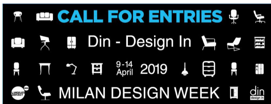
Din Design In 2019

Le aree della città che si proporranno anche per questa edizione quali punti di riferimento e di interesse saranno fra le altre Tortona Design District, Brera Design District, Ventura Project, Porta Romana , mentre si annuncia ricca di novità la proposta di Lambrate Design District , che nell'edizione 2018 del Salone aveva già visto un significativo numero di visitatori – circa 85.000 – in un'area espositiva di oltre 13.000 metri quadrati.