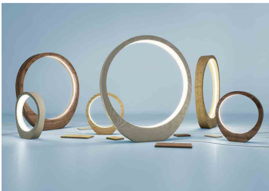
Din Design In. Alcune proposte dall'edizione 2018

Tra le iniziative di interesse in questo distretto del Fuorisalone, si segnala ad esempio la settima edizione della mostra collettiva dedicata al design ed a designer internazionali, Din-Design In , che proporrà il lavoro di più di 100 designer, aziende e accademie di design da tutto il mondo, e per il quale sono ancora aperte le selezioni per la partecipazione.